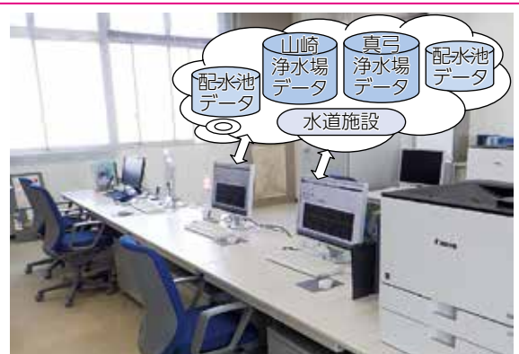
中央監視制御設備

これまで、市内全ての水道施設の運転状況を24時間365日一元的に監視してきましたが、今回の更新で水道事業の広域化にも対応できる、より効率的なシステムになりました。