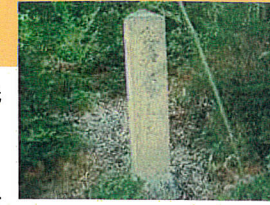
鶏山にある「金鷄発祥之處」碑

鶏山に位置する「金鷄発祥之處」碑は、歴史遺産として、愛好家が訪れる観光スポットとして親しまれており、現在地に近い位置での保存が求められます。 また、現在まで守られてきた自然の保存に配慮した計画区域の検討や、丘陵地 のり の造成にともなう傾斜地(道路法面)を活かした土地利用の検討が必要です。