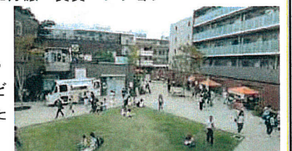
(イメージ)コトニアガーデン新川崎