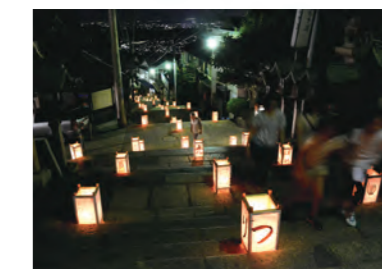
▲生駒聖天お彼岸万燈会