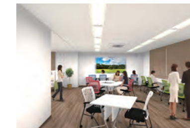
▲テレワーク&インキュベーションセンター (イメージ図)