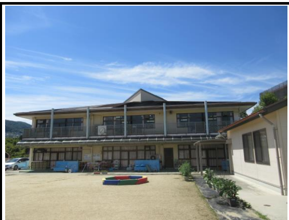
施設全体 外観写真(1)