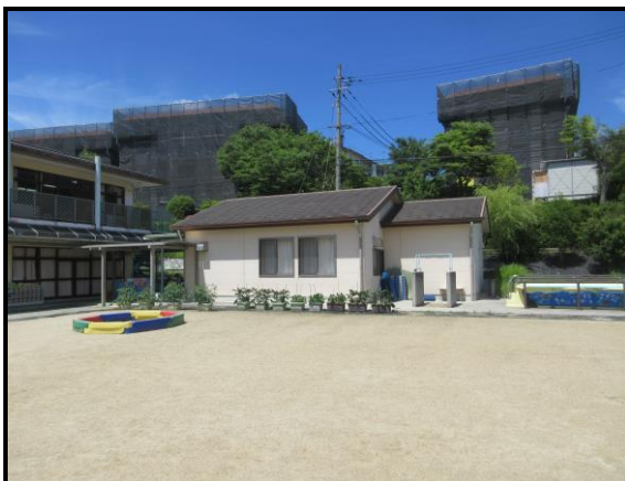
施設全体 外観写真(3)