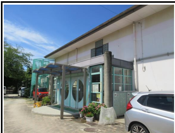
施設全体 外観写真(2)