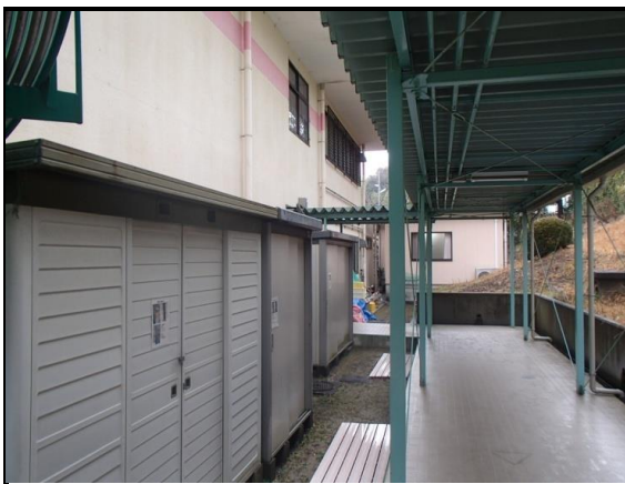
施設全体 外観写真(4)