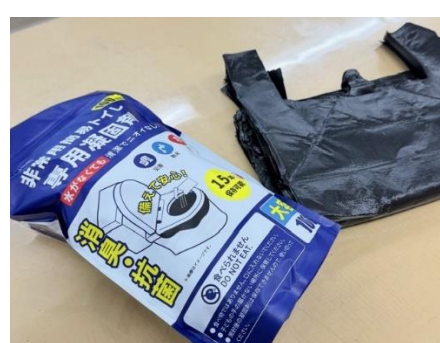
▲携帯トイレ (袋・凝固剤)