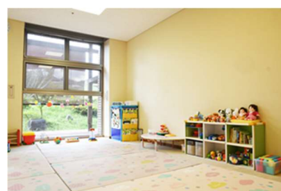
プレイルームで預かりを実施▲