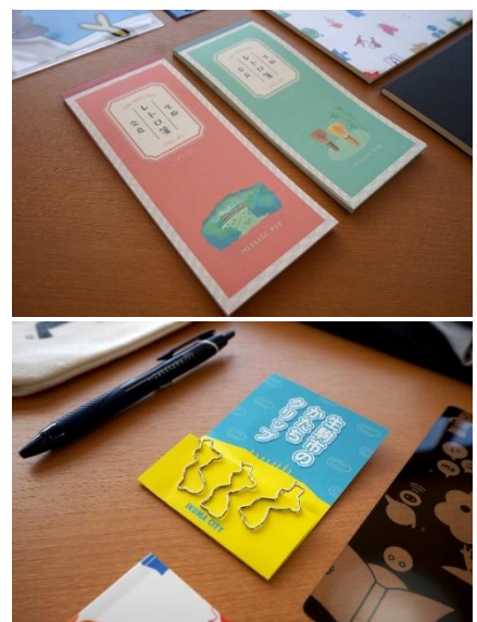
▲上：一筆箋（左から生駒山・茶釜）、下：生駒市のかたちクリップ

この件に関する報道関係からのお問い合わせ 生駒市図書館（館長 西野）☎0743-75-5000