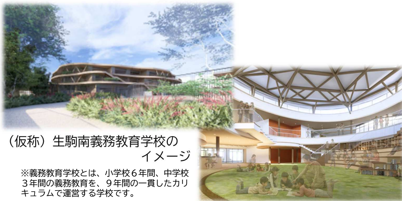
（仮称）生駒南義務教育学校のイメージ

※義務教育学校とは、小学校6年間、中学校3年間の義務教育を、9年間の一貫したカリキュラムで運営する学校です。