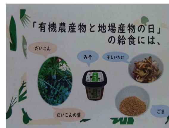
「有機農産物と地場産物の日」 (令和7年度から実施)