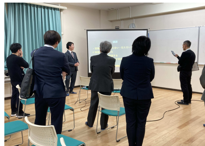
伴走・越境型研修