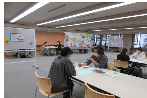
資格をいかそう！相談会