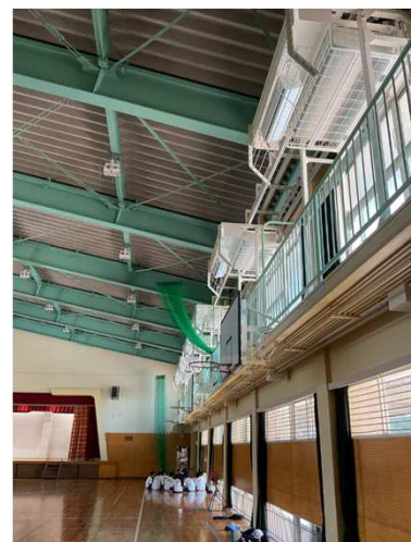
体育館のエアコン設置