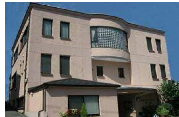
生駒市デイサービスセンター 「幸楽」を学びの多様化学校に

※義務教育学校とは、小学校6年間、中学校3年間の義務教育を、9年間の一貫したカリキュラムで運営する学校です。