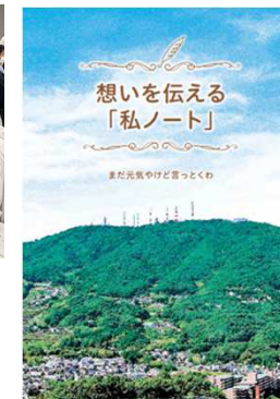
▲生駒市版エンディングノートを作成