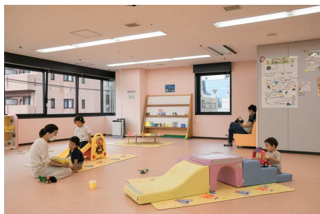
▲みっきランドを運営

妊娠期から子育て中の保護者、18歳までのすべてのこどもに対し、切れ目のない子育て支援を行うため、子育てサロン「みっきランド」や、家庭児童相談室の運営などを行っています。