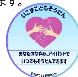
▲いこまこどもそうだん

こどもが悩みや心配事をひとりで抱え込まないように、こども専用の相談フォームを設け、こども自身が悩みを相談できるようにします。