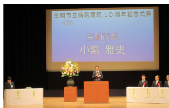
▲生駒市立病院10周年記念式典を開催