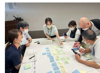
▲ワークショップを開催