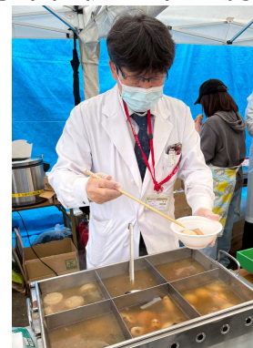
▲院長プロデュースおでんを自ら販売