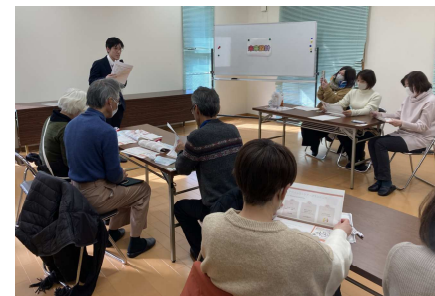
▲病院スタッフによる講演