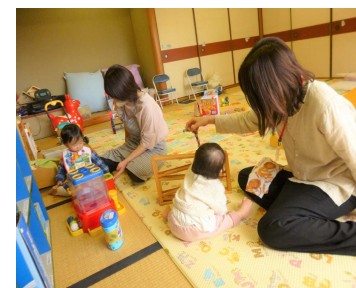
▲たっちの短時間預かり

ファミ・サポ事業の仕組みを活用した「たっちの短時間預かり」の活動場所を増やします。