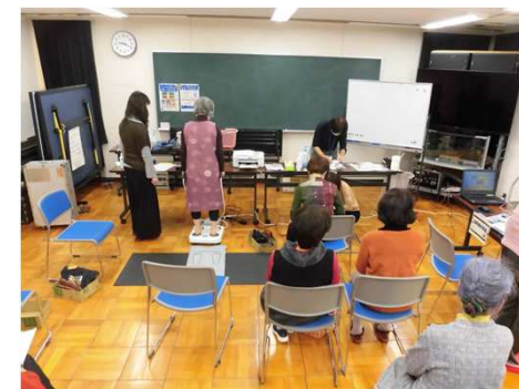
▲一体的な実施事業