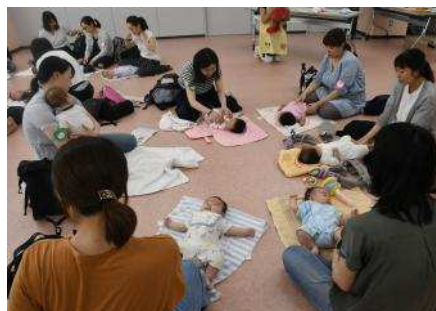
▲子育てひろばを実施