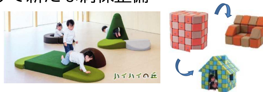
▲こどもの入院環境を整備します