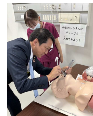
▲市長も挿管を体験