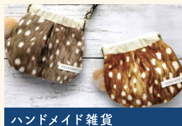
ハンドメイド雑貨