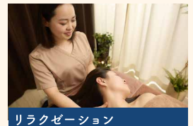
リラクゼーション