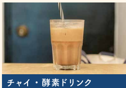
チャイ・酵素ドリンク