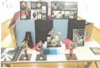
ハイキングクラブ

ハイキングクラブ、クッキングクラブ、手芸クラブ、園芸クラブ、コーラスクラブ、陶芸クラブ