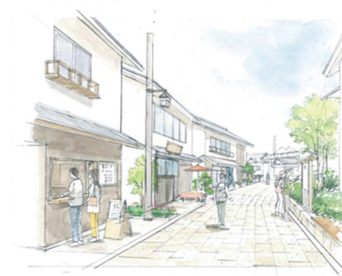
宝山寺駅周辺の修景イメージ