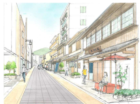
生駒駅周辺の修景イメージ