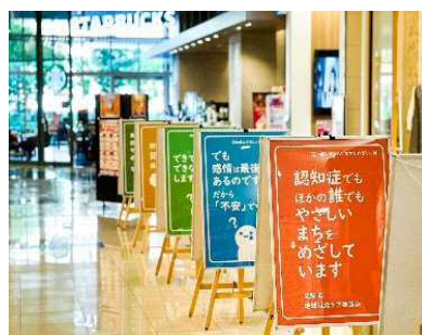
▲パネル展示の様子