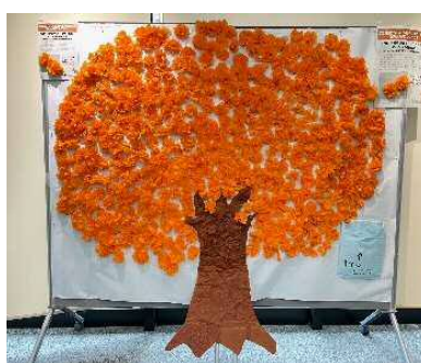
▲参加型パネル「オレンジの花をさかせよう」