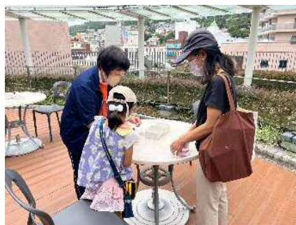
▲「手作りマスコット作成 ロバ隊長」