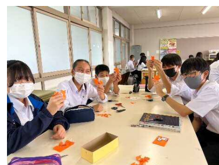
▲奈良北高校の生徒の皆さん