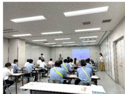
▲9月1日の講座の様子

認知症サポーター養成講座を9月1日に生駒郵便局で開催し、その内容を郵便局のご協力を得て市内全郵便局に配信いただくことで生駒市内の全郵便局員を対象にした認知症サポーター養成講座を実現。対象は市内郵便局員300人。講座終了後記入いただいたワークシートを用いて市内地域包括支援センター職員および認知症地域支援推進員とのヒアリングを実施し、地域包括支援センターと郵便局の顔つなぎを行った。