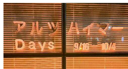
▲「コミュニティセンターライトアップ」

昨年度に引き続き、9月16～10月4日の20：00～22：00頃、1階ホワイエでのライトアップを実施。