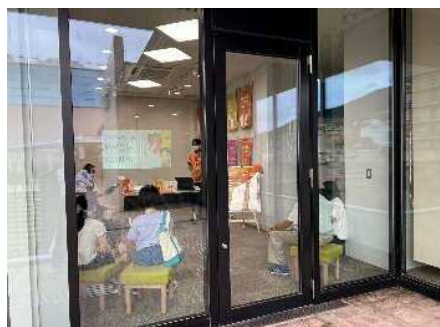
▲読み聞かせイベント「本から広がる世界」

は満開のオレンジの花が咲いた。そのほか、認知症に関連する図書を集めた特集コーナーを展示付近に設置したり、タブレット端末を用いた簡単な認知機能テスト体験会も実施した。