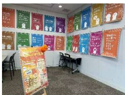
▲展示「なぜ、わたしたちは認知症の人にやさしいまち生駒をめざすのか」