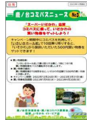
コミュニティバス鹿ノ台線の買物補助券の配布