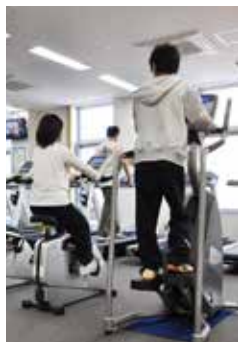
きらめきで汗を流そう

平群町と締結した相互連携協定に基づき、4月1日の申請受付分から生駒市民は同町総合文化センターを同町民料金で利用できます(料金など詳しくは、同センターホームページで確認してください)。