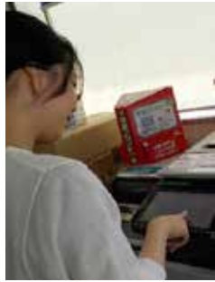
全国のコンビニで利用できて便利です