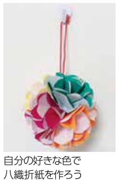
自分の好きな色で八織折紙を作ろう