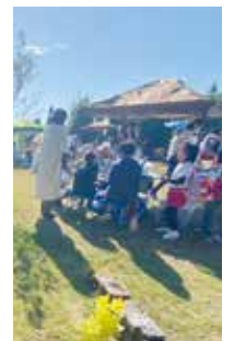
さまざまなブースでにぎわいます

マルシェ(申込不要)とT.O.M.O.&S.A.K.I.さんによるバイオリン&キーボードライブを開催します。