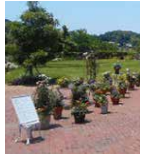
自慢の作品を多くの人に 見てもらうチャンスです

3000122、真弓1丁目11-16、☎70-0187、☎70-0287、✉hanamachi@city.ikoma.lg.jp)