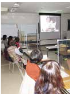
みんなで人権について考えましょう