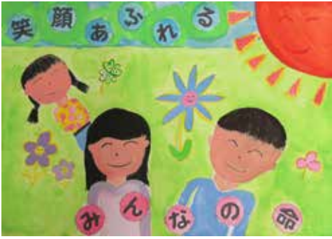
昨年度、優秀作品に選ばれたポスター