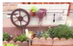
気軽に始めてみませんか

自宅の庭や玄関先など身の回りにあるちょっとした空間で、花や緑を育て、写真を通して花と緑の魅力発信につながる取組を募集します。