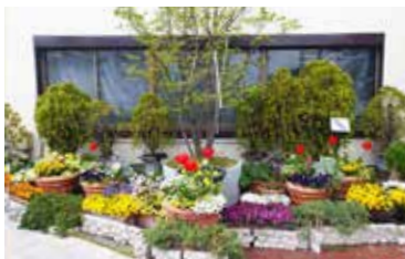
第13回最優秀賞「グリーンヒルいこま」

の写真審査を行い、1年を通じた優秀な事例を選考します(結果は来年3月頃にお知らせします)。