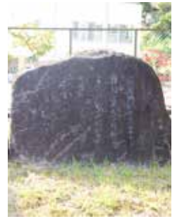
市役所前にある田辺福麻呂の歌碑