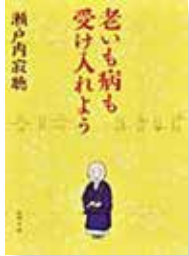
老いも病も受け入れよう 瀬戸内寂聴 しやくちよう ／著 新潮文庫

92歳のときに、相次いで襲ってきた腰椎の圧迫骨折と胆のうガン。その結果、自分の一番たいせつなことがはっきりしたといいます。「ペンを持ったまま死にたい」。本書につづられた著者の言葉はどれも心に響き、人生を前向きに乗り越える力がもらえます。