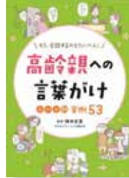
もう、会話するのもたいへん！ 高齢親への言葉かけ シーン別実例53 柳本文貴 あみだか ／監修 つちや書店

仕方がないと分かっている、いつまでも元気でいてほしい気持ちから、親の行動にイライラしたり、「これくらいできない」「がんばって」と追い詰めたりしてしまうことはありませんか。介護のプロのコツを知って、がんばり過ぎて疲れた心をゆるめましょう。