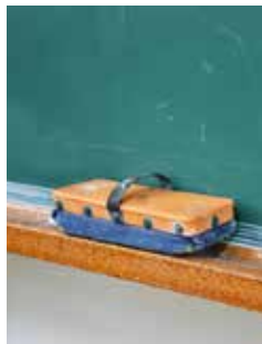
この機会に養護学校の見学・体験をしてみませんか

■ 体験学習 ▽対象 知的障がいがあり来年度、小学生・中学生になる子どもと保護者・教職員・保育士など ▽とき 小学部は9月以降に実施予定、中学部は5月30日(月)、6月6日(月)・13日(月)・20日(月) ■ 高等部入学相談 高等部の入学相談・体験学習