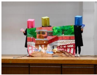
部活動紹介(美術部)