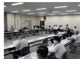
第12回役員会の様子