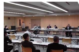
第13回役員会の様子