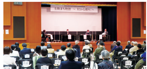
市史関連講演会「生駒まち物語～村から市へ～」

令和3年11月に市制50周年を迎えた生駒市。節目を機に、『生駒市史』の編さんがはじまりました。市制施行を記念して『生駒市誌』を発刊して以降、新たな資料や知見を蓄え、専門の研究者とボランティアの協力でまちの歩みを再編さんする作業を進めています。