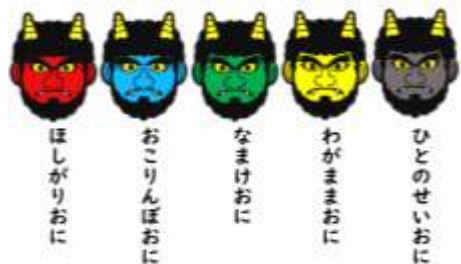
全校朝会で使用したスライドから

あいさつリレーに続いて、節分の豆まきにちなんで、心の鬼についてのお話をしました。心の中に誰もが持っている怠けたい気持ちやつい人のせいにしてまったり、悪口や陰口