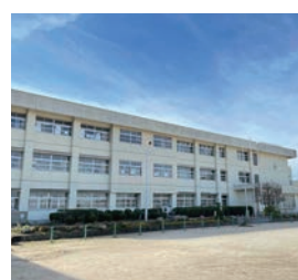
生駒南第二小学校