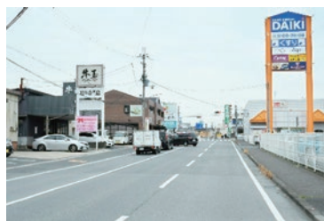
沿道生活利便施設（小瀬町）