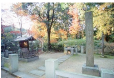
竹林寺・行基墓（有里町）