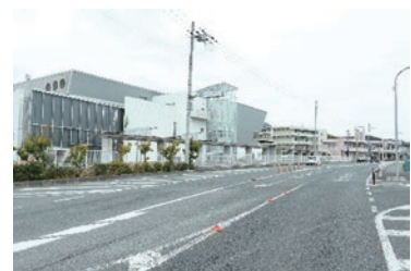
駅周辺公共施設（小瀬町）