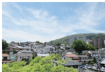
戸建て住宅地(東旭ヶ丘)と生駒山