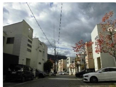
オープン外構の街並み