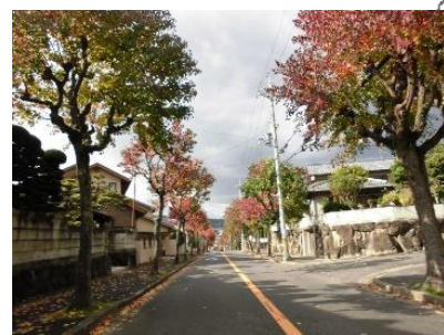
街路樹のある閑静な住宅街