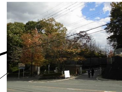
帝塚山大学(奈良市域)