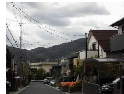
地区計画のある街並み