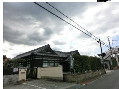
ふるさとミュージアム