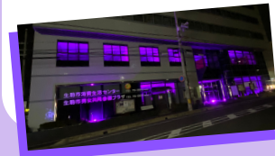
テスト点灯の様子