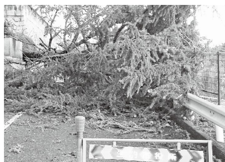
西松ヶ丘児童公園前の倒木

これまでも県も含めた総合的な情報伝達訓練を行ってきましたが、今回の経験も踏まえて実際に生きたものにしていかなければなりません。