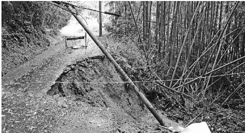
市道門前町鬼取線路肩崩れ