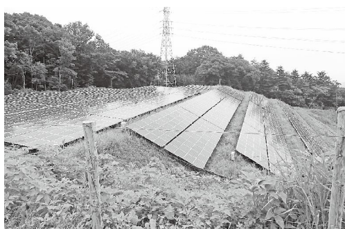
ほうとくエネルギー太陽光発電パネル