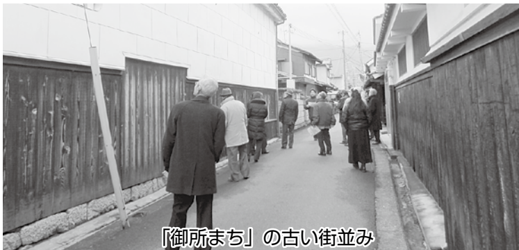
「御所まち」の古い街並み

午前中は、御所市まで行くのであれば欲張りして、まちづくりについても勉強しようということ、古地図の街並みが今も残る「御所まち」を散策し、ボランティアガイドさんの説明を受け、先人の知恵、江戸時代初期のまちづくりを学習しました。