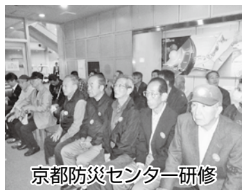
京都防災センター研修