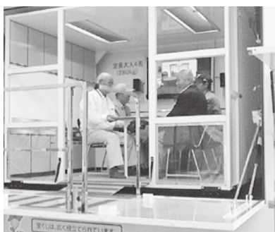
起震車による震度7の地震体験

兵庫県三木市の兵庫県広域防災センターで体験メニューによる学習を、震度七の地震体験や煙避難体験をしました。