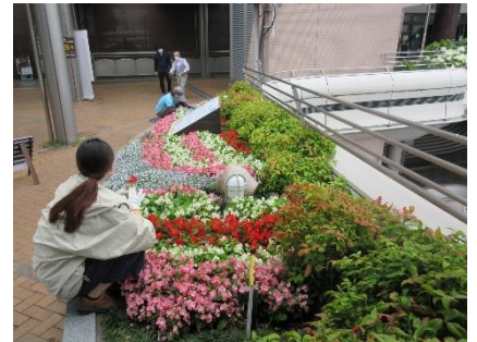
これは何のお花？と声をかける人も