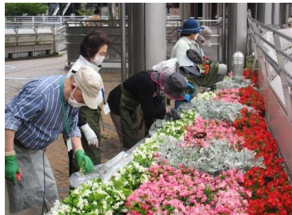
花ガラを1つ1つ摘んでいきます