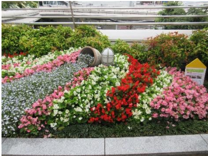
満開！壺から水が流れるイメージです

前回植え替えを行った花だんの手入れを行いました。花が散った後の「花ガラ」や、伸びすぎた花を茎の根本から1つ1つ丁寧に摘んでいくと、その下からは新しい花芽が顔を出してくれました。満開を迎えている花だんですが、まだまだ楽しませてくれそうです。