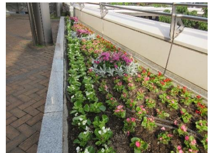
完成！きれいに育つのが楽しみです