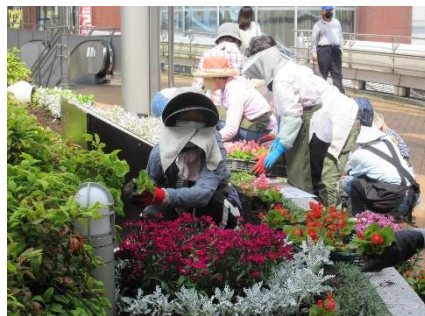
1株ずつ丁寧に植えています