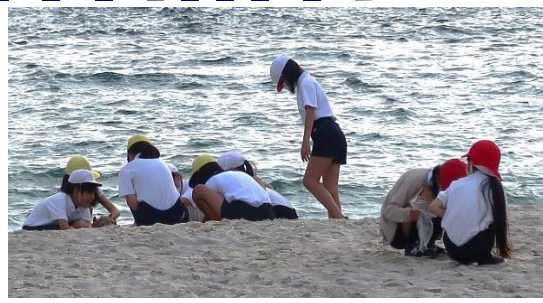
修学旅行 1日目 白良浜の散策。 美しい砂浜と海の波を思い切り満喫。靴が濡れてしま うハプニングも、今となっては思い出の一つです。