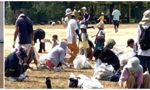
PTA 主催のクリーン作戦。子どもたちや保護 者、地域の方、教職員と一緒に汗を流しながら、 夏に伸びた運動場の草を抜きました。

「暑さ寒さも彼岸まで」の言葉どおり、秋分の日を境に朝夕はめっきり涼しい風が吹くようになりました。9月9日(土)のクリーン作戦には、多くの皆様にご参加いただき、本当にありがとうございました。おかげさまで、夏草におおわれていた運動場がすっかりきれいになり、子どもたちも安全に楽しく体育学習や自由遊びを行うことができるようになりました。心より感謝申し上げます。