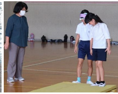
4年生:生駒市福祉センターの方と アイマスク体験を行いました。小さな 段差や曲がり道もドキドキしました。