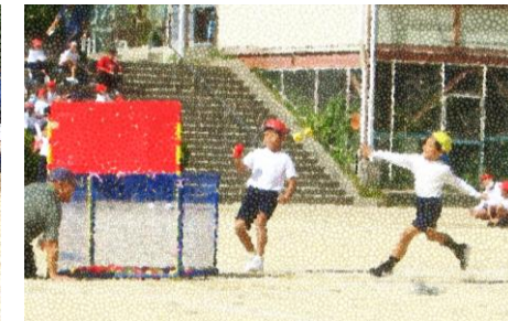
3年 投げて走ってリレー玉入れ