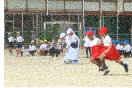
2年 息を合わせて!デカパンリレー

9:30~10:00 金管バンドの演奏(体育館) 10:00~12:00 石ころクラブ、グランドゴルフ、モルック、サッカーPK、スリッパ飛ばし、図書リユースなど ※雨天の場合は、上靴・スリッパをご持参ください