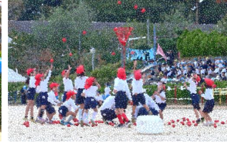
1年 ダンシング玉入れ

秋が深まり、校内の木々の葉も赤や黄にだんだんと色づいてまいりました。去る10月21日(土)の運動会には、多くみなさまにご来校いただきありがとうございました。個人競技や団体競技、応援披露、係活動などでの、子どもたちの一生懸命な姿とすてきな笑顔をとくさんご覧いただくことができたのではないかと考えております。みなさまのご協力のおかげで、楽しく充実した時間となりました。心より感謝申し上げます。