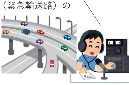
主要道路（緊急輸送路）の 状況確認