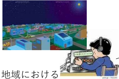
地域における 停電・断水等の発生 その他近隣の被害状況の通報