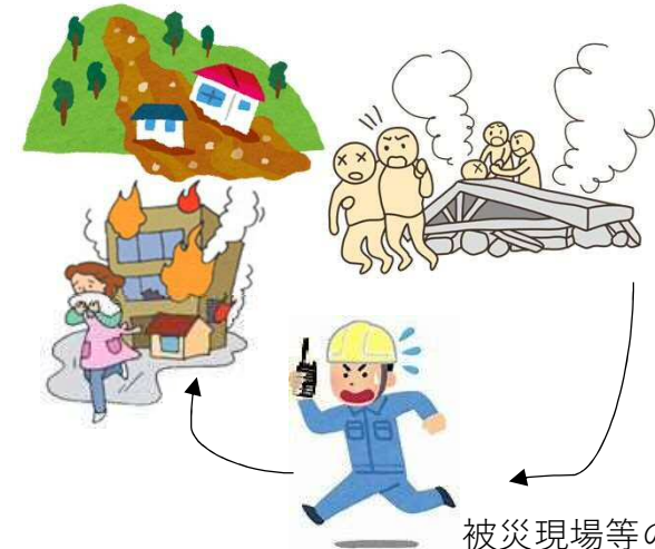
被災現場等の 状況の確認・通報