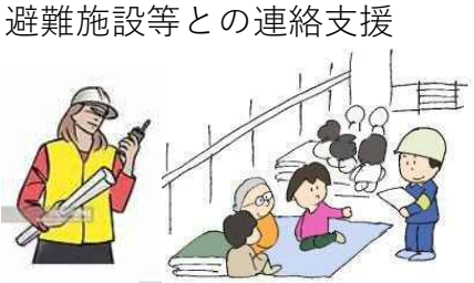
避難施設等との連絡支援