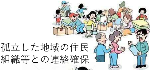
孤立した地域の住民 組織等との連絡確保