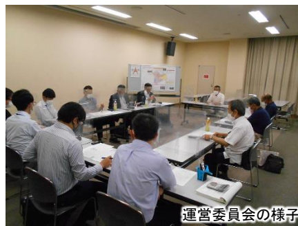
運営委員会の様子