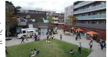
(イメージ) コトニアガーデン新川崎