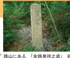
鷄山にある「金鷄発祥之處」碑

鷄山に位置する「金鷄発祥之處」碑は、歴史遺産として、愛好家が訪れる観光スポットとして親しまれており、現在地に近い位置での保存が求められます。また、現在まで守られてきた自然の保存に配慮した計画区域の検討や、丘陵地形の造成にともなう傾斜地（道路法面）を活かした土地利用の検討が必要です。