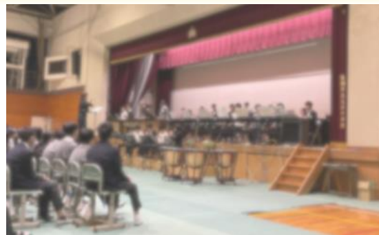
12月12日(金) 体育館で器楽合奏発表会!!