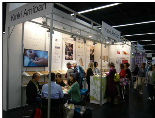
ケルン展示会での商談風景(2018)

生駒市生まれの47歳。 創業104年、日本産の竹を使って 手芸用の竹編針を作っています。 現職20年目、4代目(予定)。 趣味はちょっとだけ古い車を磨くこと。 日本国内では編針と共に輸入毛糸の販売も 手掛け、海外では編針の新規顧客開拓に 力をいれています。 世界最大のドイツ・ケルンのh+h手芸展示会 など2年前から海外展示会へも出店しています。