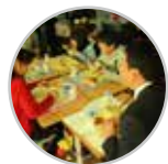
幼稚園・保育園・ 小中学校情報 @lkoma_k_shinkou

防災安全課の公式アカウント。地震や台風などの災害情報を知れる他、災害時に役立つ防災豆知識もツイートします。公式アカウントの中では、災害情報をいち早く知ることができるアカウントです。