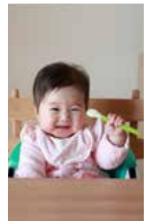
離乳食の試食もあります

一子)の保護者 ▼とき・ところ 7月1日(月) 9時45分~12時、セラビーいこま ▼内容 離乳食についての講義や調理実習などをします。作った離乳食の試食もあります。