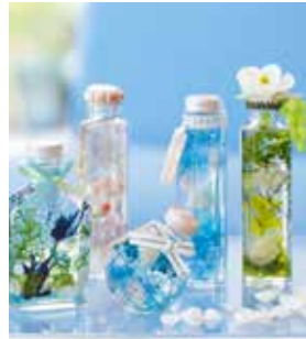
夏らしいハーバリウムが作れます