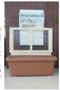
キエーロで生ごみを減らそう

▼とき・ところ ①6月29日(土)②30日(日)、13時～17時30分の間で約1時間30分、エコーパーク21