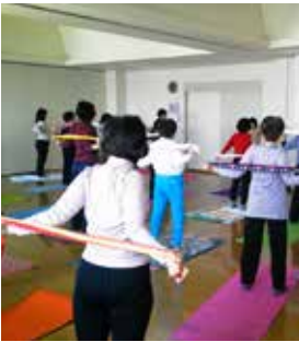
みなでいっしょに楽しく体を動かしましょう

ムを使って、良い姿勢で運動します。骨盤のトレーニングで、ひどい肩こりの解消を目指しましょう。