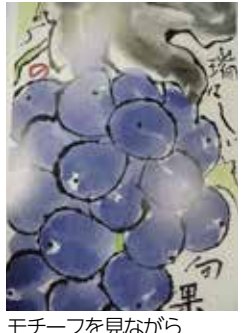
モチーフを見ながら絵手紙を作りましょう

▼申込み・問合せ 3月12日(火)～17日(日)にファクスかメールに郵便番号、住所、氏名、電話番号、講座名を書いて、南コミュニケーションセンター講座受付係(☎77・0001、☎