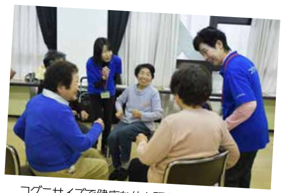
コグニサイズで健康な体と頭を目指しましょう