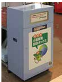
小型家電回収ボックス