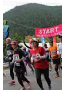
大台ヶ原を駆け抜けませんか