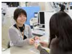
マイナンバーカードは窓口で受け取れます

—受け取りされていないマイナンバーカードは約1年で廃棄します。この機会に受け取りください。