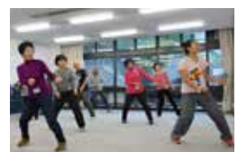
動きの大きいエクササイズで元気な体作りをしましょう