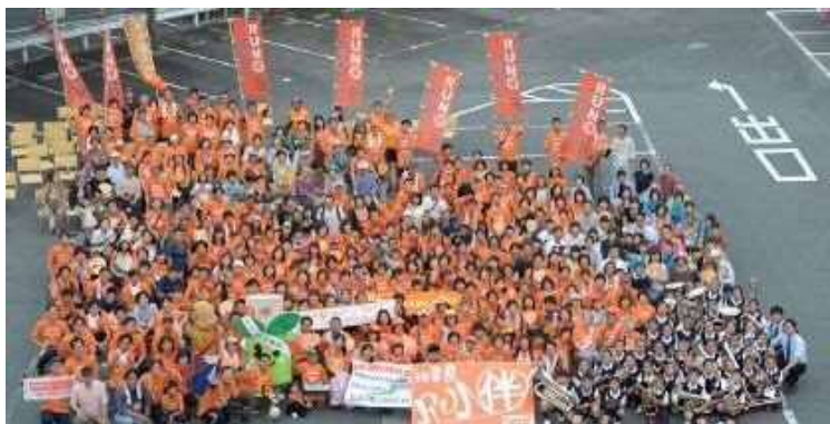
H28の様子 (小学生のブラスバンドも参加)