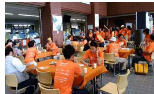
市役所ロビーに当日のみのミニカフェをOPEN