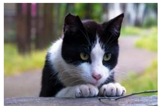
避妊手術を行った猫（耳のVカットが印）