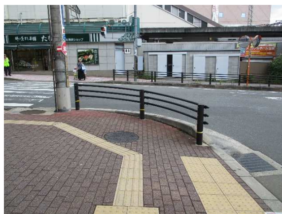
対策工事後のイメージ(防護柵の設置)