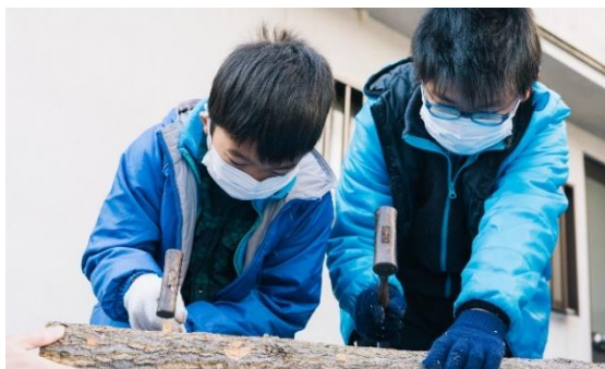
初めての菌打ち体験に子どもたちは熱中！