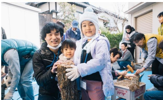
それぞれの「マイ椎茸」が完成！