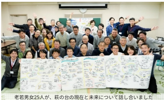
老若男女25人が、萩の台の現在と未来について話し合いました

次回12/21（土）以降は、アイデアの実現に向け、できることから取り組んでいきます。