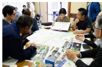
地区の魅力や心配事などをグループで共有