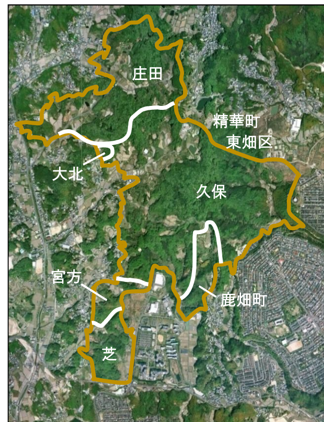
第2工区地区別航空写真

平成30年5月19日 上記以外の地区対象勉強会 (意見交換会) ・地権者組織について ・発起人の募集