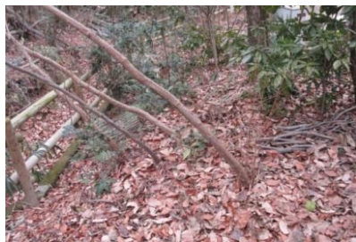
倒れた樹木を起し、支柱を設置