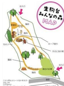
色あせていた森の図面の貼り替え