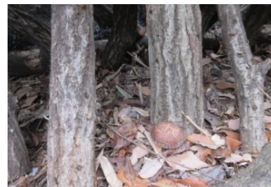
美味しそうなシイタケ