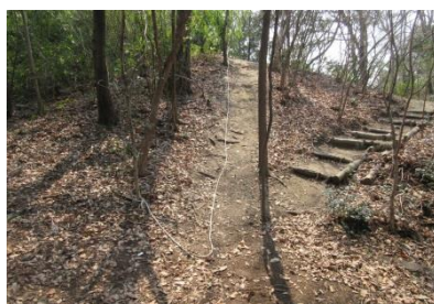
整備後のロープのぼり場