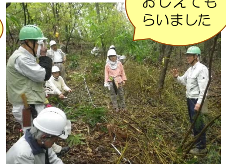
ルート上にある、いらぬ木をみんなで切っていました。