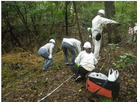
ササを刈ったあとの森をかくにんし、みちのルートをかんがえました。