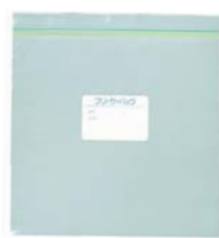
フリーザーパック