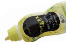
中身が垂れてこない