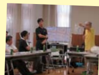
間違えやすいごみの分別を自治会に紹介

「ごみ減量市民会議」は、市民の皆さんと事業者、市で構成される団体。ごみ減量に向けて自治会の集会で分別の疑問に答えたり意見を出し合ったりしています。また、子どもたちには食品のたいせつさを教える授業を実施。市全域で啓発を実践しています。