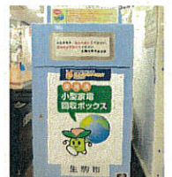
▲投入口に入るサイズは無料で回収