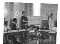
間違えやすいごみの分別を自治会に紹介

「ごみ減量市民会議」は、市民の皆さんと事業者、市で構成される団体。ごみ減量に向けて自治会の集会で分別の疑問に答えたり意見を出し合ったりしています。また、子どもたちには食品のたいせつさを教える授業を実施。市全域で啓発を実践しています。