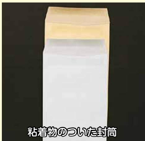
粘着物のついた封筒