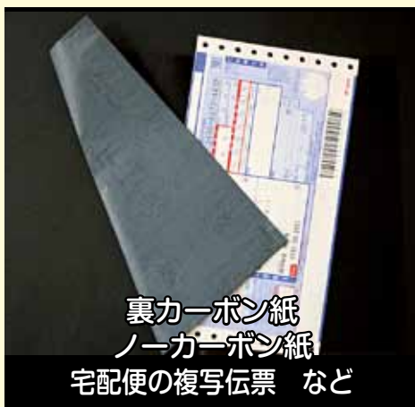
裏カーボン紙 ノーカーボン紙