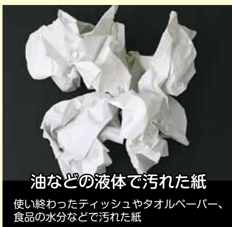
油などの液体で汚れた紙