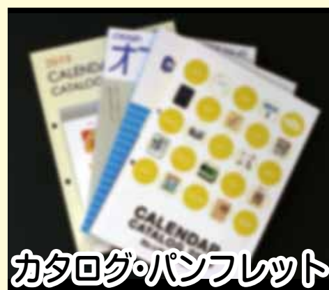
カタログ・パンフレット