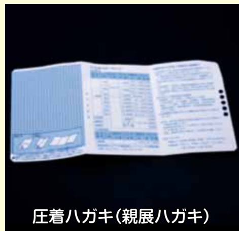
圧着ハガキ (親展ハガキ)