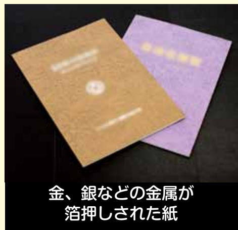
金、銀などの金属が箔押しされた紙

これらは、「製紙原料にならないもの」として扱われるもので、リサイクルできないことから、燃えるごみとして出させていただくことになります。