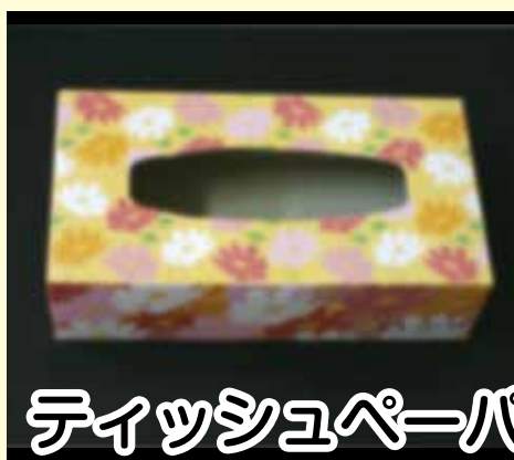
ティッシュペーパーの箱