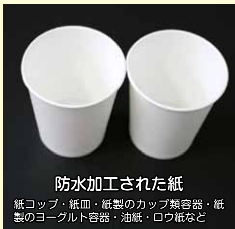
防水加工された紙