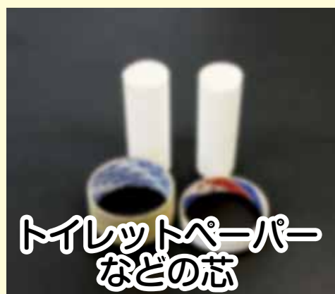
トイレットペーパー などの芯