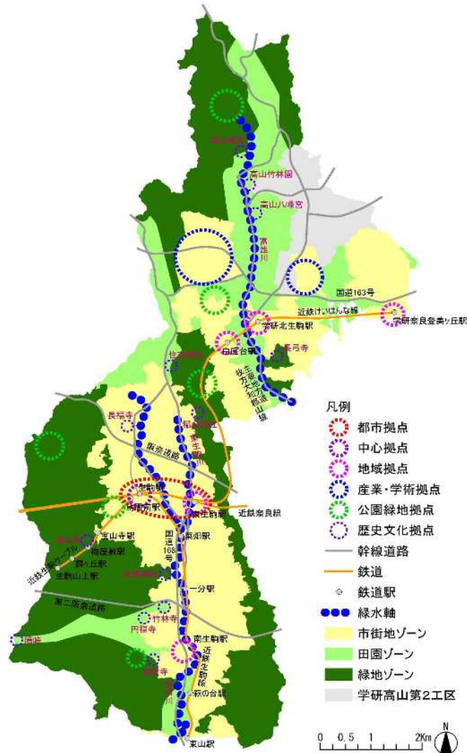
将来の都市構造図